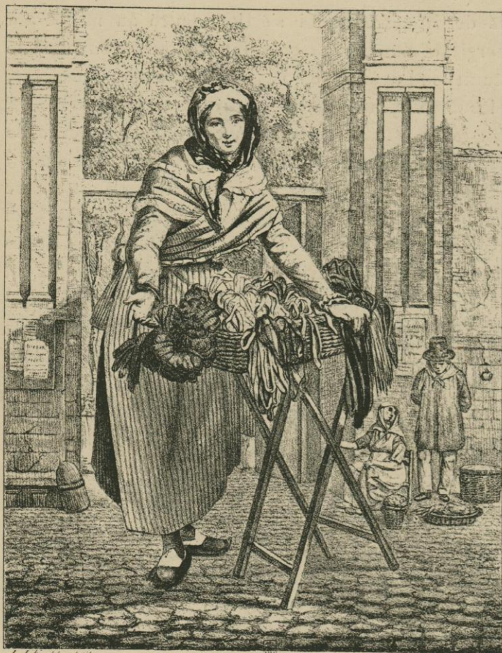
MARCHANDE DE RUBANS ET VUE DE L'ENTRÉE DU MARCHÉ AU-BEURRE.

Le décret de reconstruction est de 1852. En 1853, les fondations furent éta-